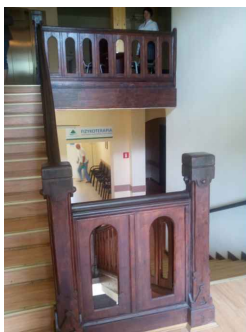
F7. Bieg między II i III piętrem